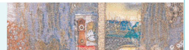
« Le temps » Mélange de nombreuses matières, broderies machine et main (pour les reliefs), peinture, inclusion d'un timbre avec motif d'horloge. De nombreux plans se superposent pour une grande profondeur liée à l'idée du temps. Ils évoquent les choses d'hier et celles d'aujourd'hui qui se tissent en une même étoffe. Nouvelle piste d'expérimentation, Ina Georgeta mélange de plus en plus broderies et papiers qu'elle coud.