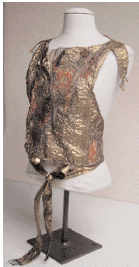
Broderie réalisée sur tulle pour la haute couture, avec fils à broder et fils métalliques ensuite rehaussés de perles.